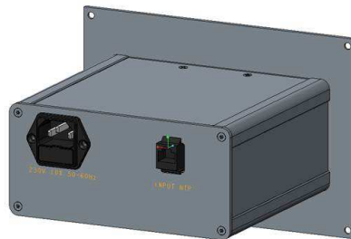
230 VAC Rückseite Kabel im Lieferumfang: 2 m. Netz AC EU/IEC C13